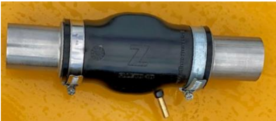
Fot. FLUSTO 40