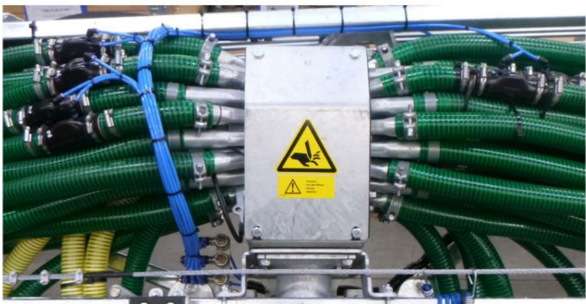
Fot. FLUSTO 40 zamontowany na Glidefix